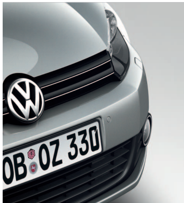
С защитной пленкой Volkswagen V-Protector