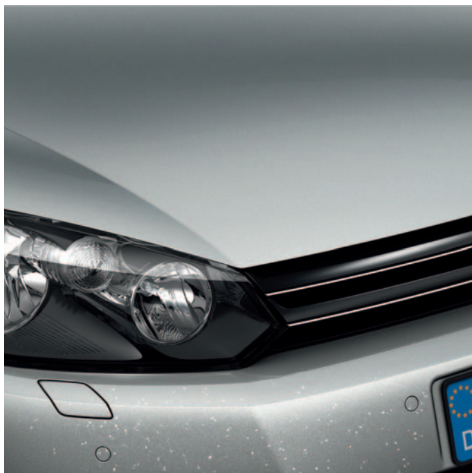
Без защитной пленки Volkswagen Original V-Protector